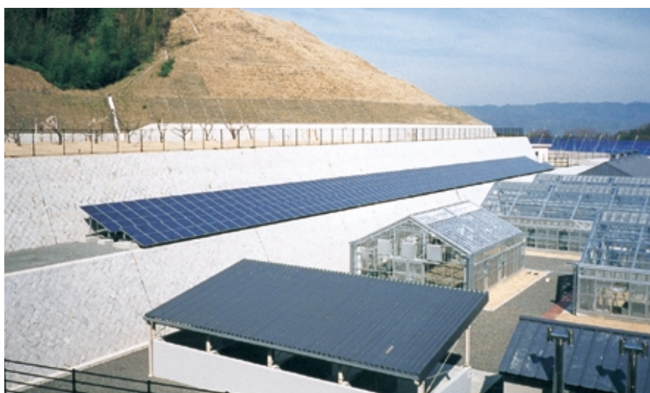
2 石積擁壁太陽電池52kW